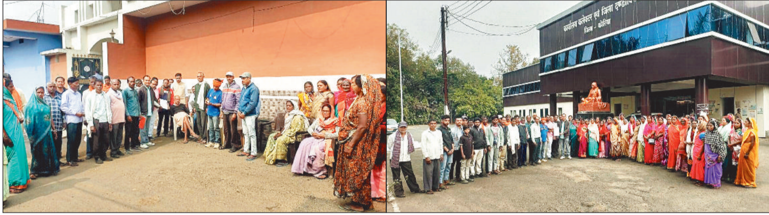
विधायक से मिलते ग्रामीण।