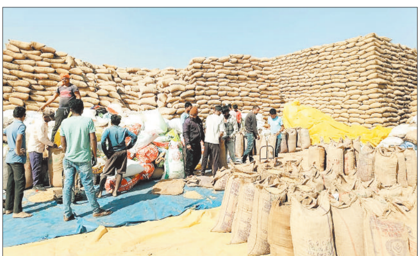
धान खरीदी केन्द्र।